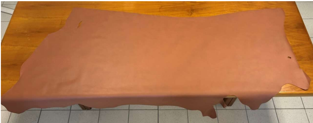
Esempio di pelle rifinita per mezzo della tecnologia sviluppata, fissativo opaco.